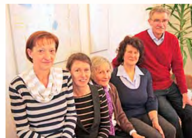
Sie gehören zum großen, ehrenamtlichen und unentbehrlichen Helferteam!

Deutschland nicht möglich. Die ehrenamtlich Tätigen leisten Unglaubliches und zeigen durch ihren Einsatz auch Offenheit gegenüber der immer noch tabuisierten Krankheit Demenz. Ihre zuverlässige und regelmäßige Einsatzbereitschaft verdient daher Respekt und Anerkennung!