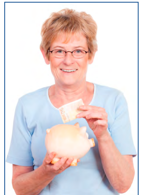
Kirchliche Arbeitgeber bieten diverse Modelle an, Gehalt anzusparen.

Uns liegt viel daran, unsere Mitarbeitenden darin zu unterstützen, den