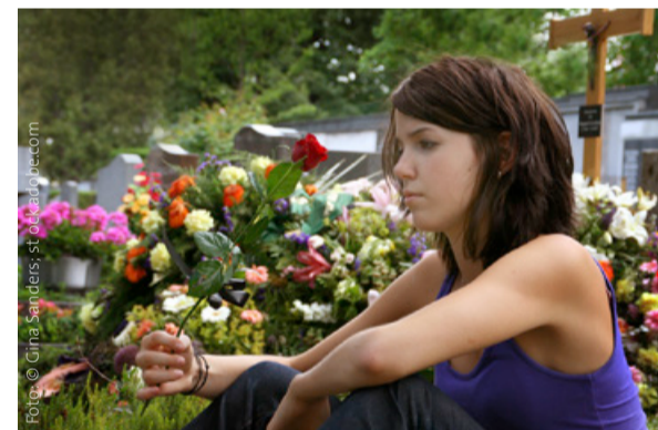
Begleitung und Austausch helfen.

Einmal im Monat können Trauernde in einem geschützten Raum miteinander ins Gespräch kommen und